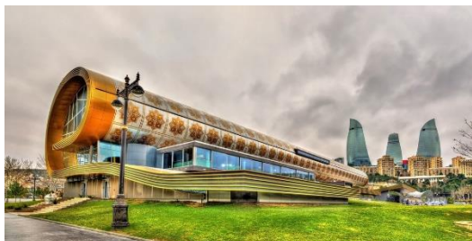
МУЗЕЙ АЗЕРБАЙДЖАНСКОГО КОВРА 1967.